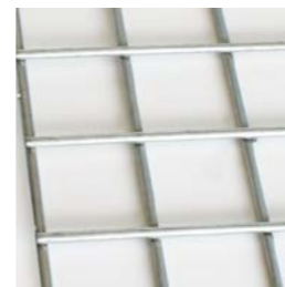
40 x 40 mm – Fil 3 mm