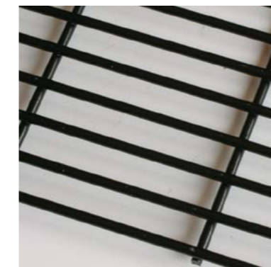
Plastifié noir – RAL 9005

FABRICATION SUR MESURE à la demande selon vos dimensions et les mailles voulues.