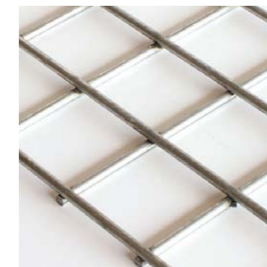
40 x 40 mm – Fil 4 mm