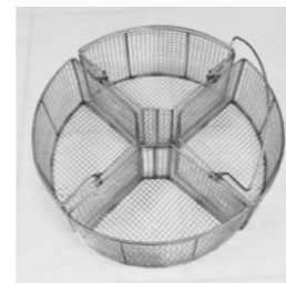
6 x 6 mm – Fil 1 mm