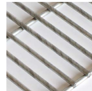
80 x 10,5 mm – Fil 3 et 4 mm