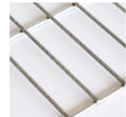
80 x 20 mm – Fil 3 et 4 mm